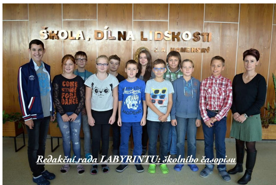
Redakční rada LABYRINTU: školního časopisu

LABYRINT: školní časopis Základní školy Benešov, Dukelská 1818