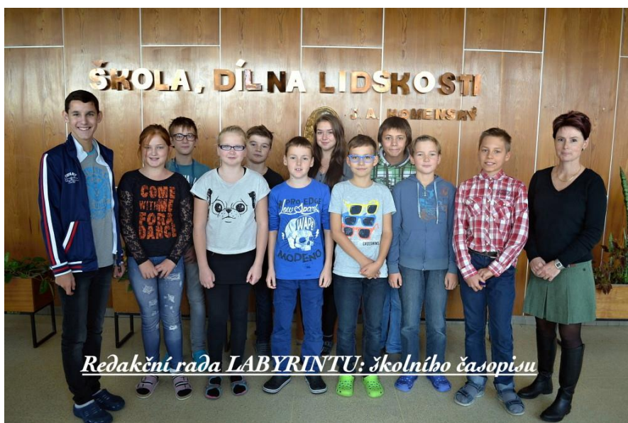
Redakční rada LABYRINTU: školního časopisu

LABYRINT: školní časopis Základní školy Benešov, Dukelská 1818